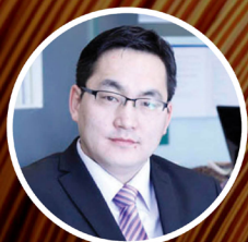
Ч.ОТГОЧУЛУУ Эдийн засагч