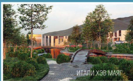
ИТАЛИ ХЭВ МАЯГ