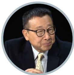
ТОНИ КВОК ОЛОН УЛСЫН АВЛИГЫН ЭСРЭГ ЗӨВЛӨХ